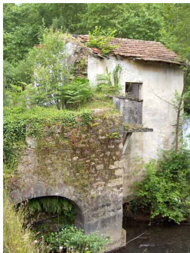
En primer término, los restos del molino. Detrás de éste, la central. Foto: Xabier Cabezón (2006)

En el término municipal de Andoain . La presa se encuentra en el río Leitzarán , a 425 metros de su desembocadura en el Oria. El molino está unos 18 metros más abajo de la presa, en la margen derecha del río Leizarán, bajo las casas de Olagain. Partiendo de la antigua carretera general de Andoain (actual Kale berria) se cruza por debajo de las vías del ferrocarril de RENFE, y a mano derecha (por delante de Opuá) se toma el camino que conduce directamente, junto a la orilla del río, al antiguo molino. Coordenadas: X 579.655 Y 4.785.020 (2° 1' 9,8" W - 43° 12' 46,7" N, Hoja 64-44) (ED50 zona 30T), a 45 metros de altitud.