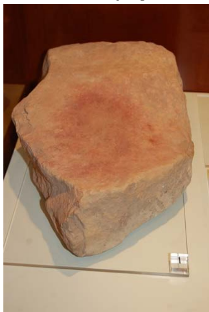
Molino de colorante realizado en arenisca. Cueva del Arco PALEOLÍTICO SUPERIOR, magdaliense final, 10.000-7.000 A.C.