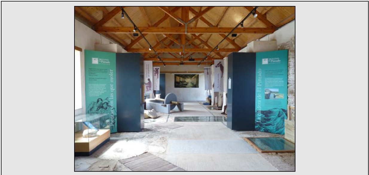
Sala de molienda con la exhibición interpretativa instalada (septiembre de 2.009).

Para la interpretación del Molino Mareal y del Paraje Natural se ha intervenido primero en los exteriores del edificio, mediante la instalación de paneles que, además de identificar las infraestructuras del Molino –camino, caldera, embarcadero...-, ayudan a la comprensión del paisaje marismeño, de indudable belleza y valor ecológico.