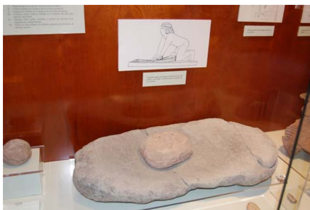
Ejemplar mostrado junto a trigo y cebada hallados en niveles neolíticos.

No haré aquí un análisis de los mismos, sino que mi única intención es una enumeración para compartir con vosotros el sentimiento de ver que nuestra afición molinológica está tan unida a nuestro pasado.