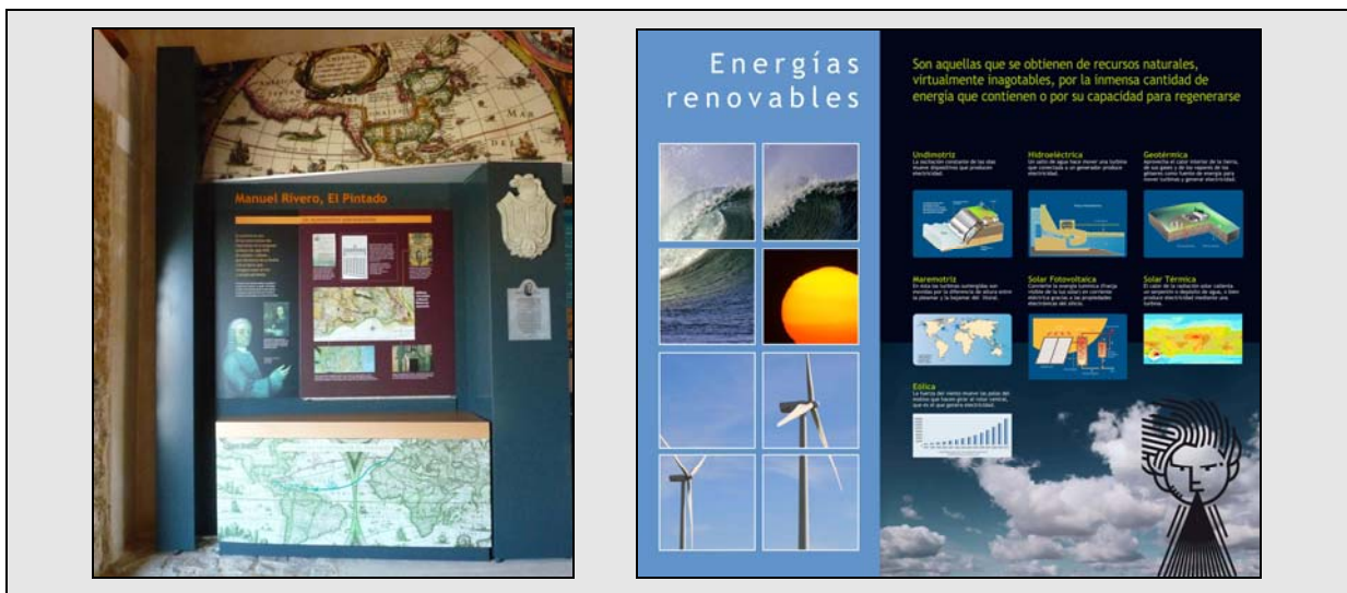
Panel dedicado a El Pintado, indiano ayamontino propietario del Molino original.