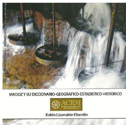
Portada del CD con el estudio realizado por el etnólogo Koldo Lizarralde, sobre los molinos en el Madoz