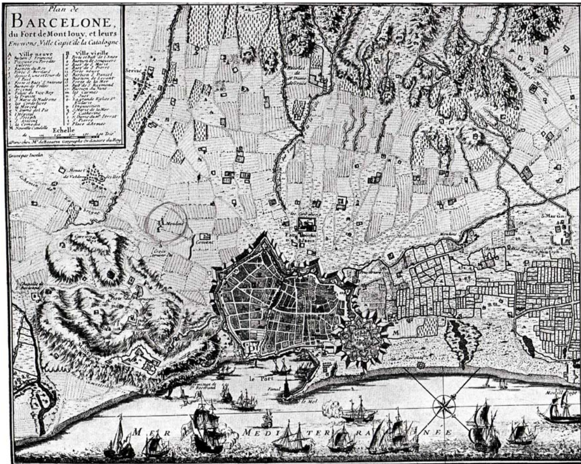
Foto: Gravado de 1718 en el que se pueden observar a la izquierda los molinos de la Creu Coberta, (en un círculo) aunque en el dibujo aparecen tres en lugar de los dos que se citan en la documentación.